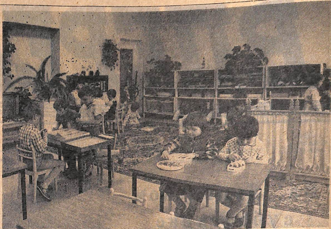
На днях исполнилось 10 лет детскому комбинату № 16 «Рябинка». В ближайших номерах будет опубликован рассказ о работе коллектива.

На снимке — так выглядит одна из групп «Рябинки».